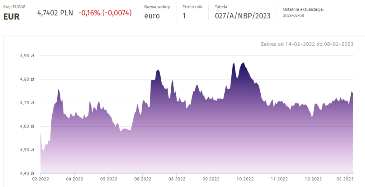
Wykres 1. Kurs euro wg NBP

Obowiązującą walutą w Holandii jest euro (EUR), podobnie jak w większości krajów należących do Unii Europejskiej. Waluta została wprowadzona od 1 stycznia 1999 r. 1 euro (EUR, €) jest podzielone na 100 eurocentów. W obiegu są monety 1, 2, 5, 10, 20, 50 centów, 1€, 2€ oraz banknoty 5€, 10€, 20€, 50€, 100€, jak również rzadko używane 200€ i 500€.