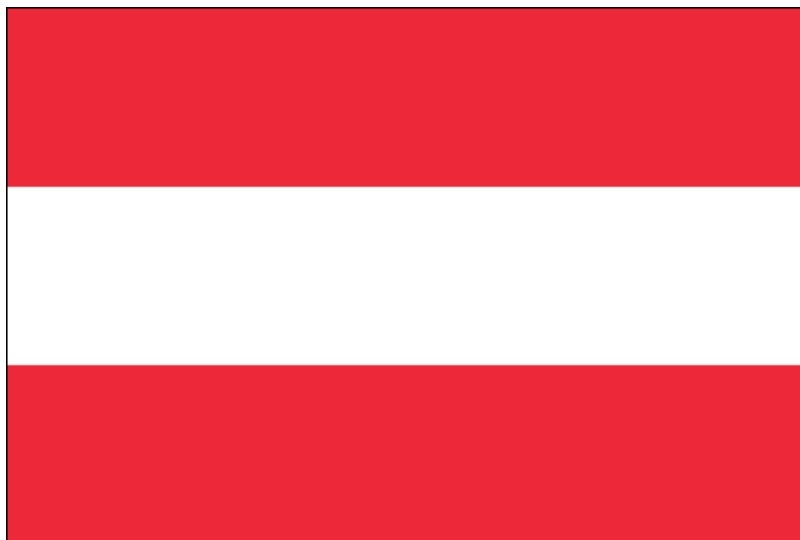
Obraz 1 Flaga Austrii