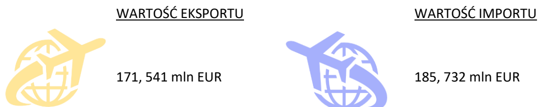
Rysunek 2. Wartość eksportu i importu Austrii w 2021 r.